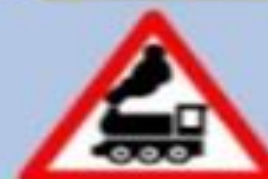
1.2 «Железнодорожный переход без шлагбаума»

Этот знак устанавливается перед железнодорожными переходами со шлагбаумом. Он предупреждает водителей о возможности появления поездов на проезжей части.