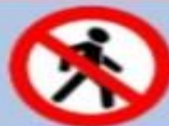
3.10 «Движение пешеходов запрещено»

Этот знак устанавливается перед пешеходными переходами, где часто ходят пешеходы. Он предупреждает водителей о возможности появления пешеходов на проезжей части.