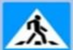
5.19.1, 5.19.2 «Пешеходный переход»

Этот знак устанавливается на велосипедных дорожках. Он предупреждает водителей о возможности появления велосипедистов на проезжей части.