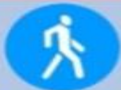
4.5 «Пешеходная дорожка»

Там, где висит этот знак, пешеходам ходить нельзя.