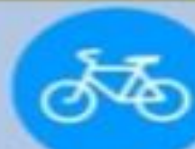
4.4 «Велосипедная дорожка»

Там, где висит этот знак, кататься на велосипеде или мопеле нельзя.