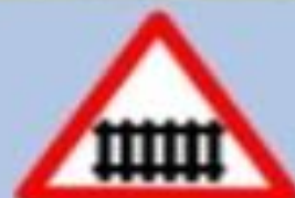
1.1 «Железнодорожный переход со шлагбаумом»

Этот знак устанавливается перед железнодорожными переходами со шлагбаумом. Он предупреждает водителей о возможности появления поездов на проезжей части.