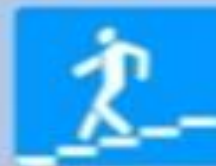
6.6 «Подземный пешеходный переход»

Эти знаки – для пешеходов. Они указывают место безопасного места для перехода проезжей части.