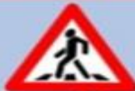
1.22 «Пешеходный переход»

Этот знак устанавливается перед пешеходными переходами, где часто играют дети. Он предупреждает водителей о возможности появления детей на проезжей части.