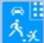
5.21 «Жилая зона»

Этот знак устанавливается перед железнодорожными переходами без шлагбаума. Он предупреждает водителей о возможности появления поездов на проезжей части.