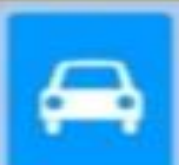
5.3 «Дорога для автомобилей»

Этот знак устанавливается на автомагистралях. Он предупреждает водителей о возможности появления автомобилей на проезжей части.