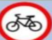
3.9 «Движение на велосипедах запрещено»

Там, где висит этот знак, кататься на велосипеде или мопеле нельзя.