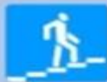
6.7 «Надземный пешеходный переход»

Этот знак устанавливается на пешеходных дорожках.